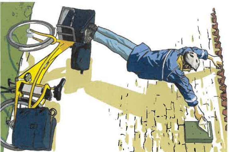
▶ Boîte aux lettres trop haute