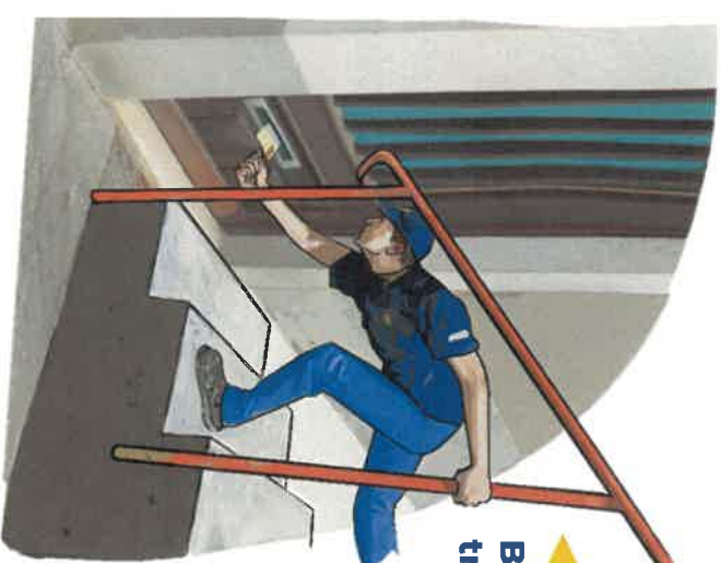
▶ Boîte aux lettres trop basse