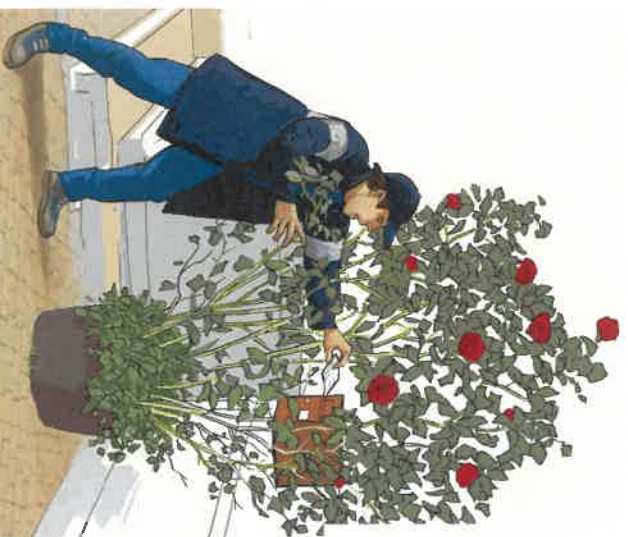
▶ Boîtes aux lettres inaccessibles