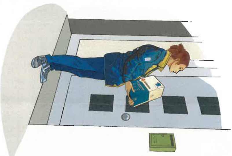
▶ Boîte aux lettres trop petite